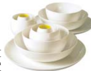
Berner Porzellan. Bild: Bottoni

In Simone Stockers Porzellan-Atelier Bottoni in Bern entstehen Kunstwerke, aus denen man isst und trinkt. «Torlo» etwa besteht aus fünf Teilen, die wie gewachsen ineinander stehen, schlank, elegant und spülmaschinenfest. Das preisgekrönte Geschirrsset gibts unter anderem am Weihnachtsverkauf des Ateliers vom 7. bis 9. Dezember jeweils 12 bis 18 Uhr an der Schön-